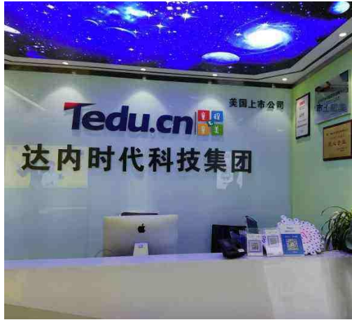
达内时代科技集团