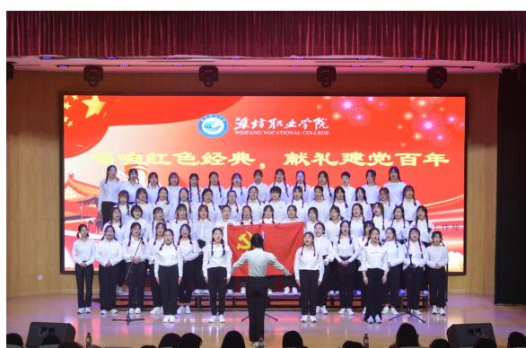
献礼建党百年合唱比赛