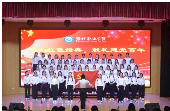
献礼建党百年合唱比赛