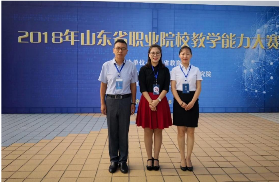
山东省职业院校信息化教学比赛一等奖