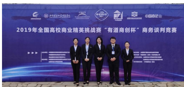
2019年全国高校商业精英挑战赛商务谈判竞赛决赛二等奖