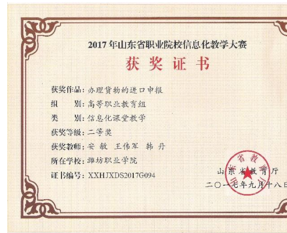
山东省职业院校信息化教学大赛二等奖