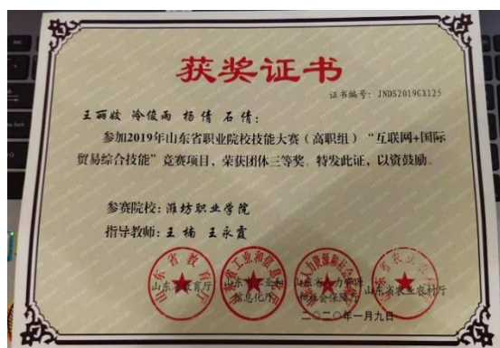
山东省职业院校技能竞赛三等奖