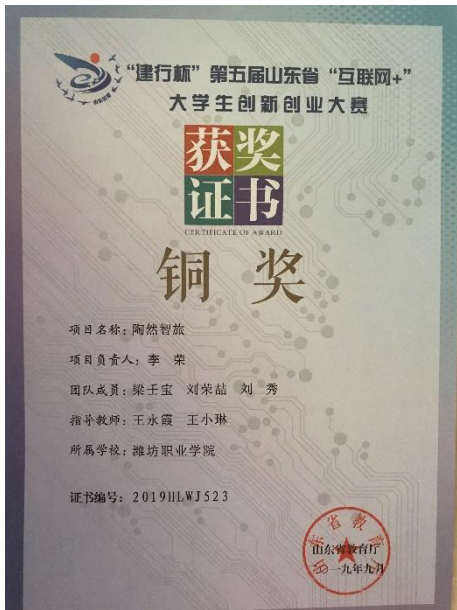
山东省互联网+创新大赛创业三等奖