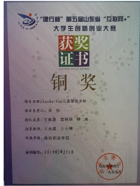
山东省互联网+创新创业大赛三等奖