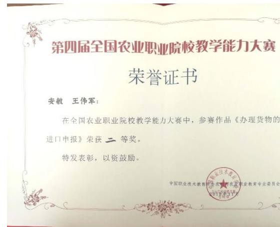
全国涉农职业院校教学能力大赛二等奖