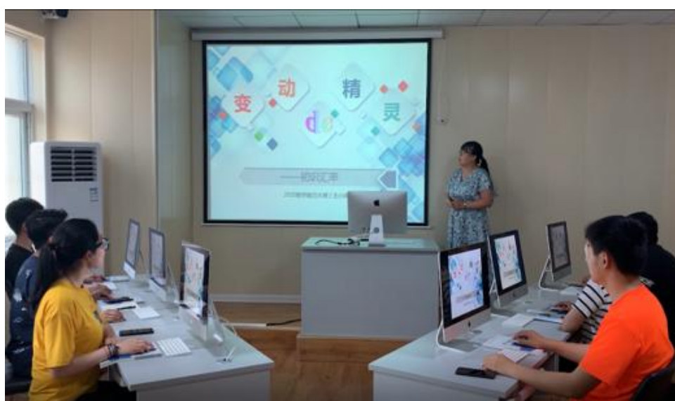
广告学实务课程教学