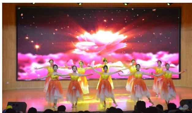
元旦晚会文艺汇演