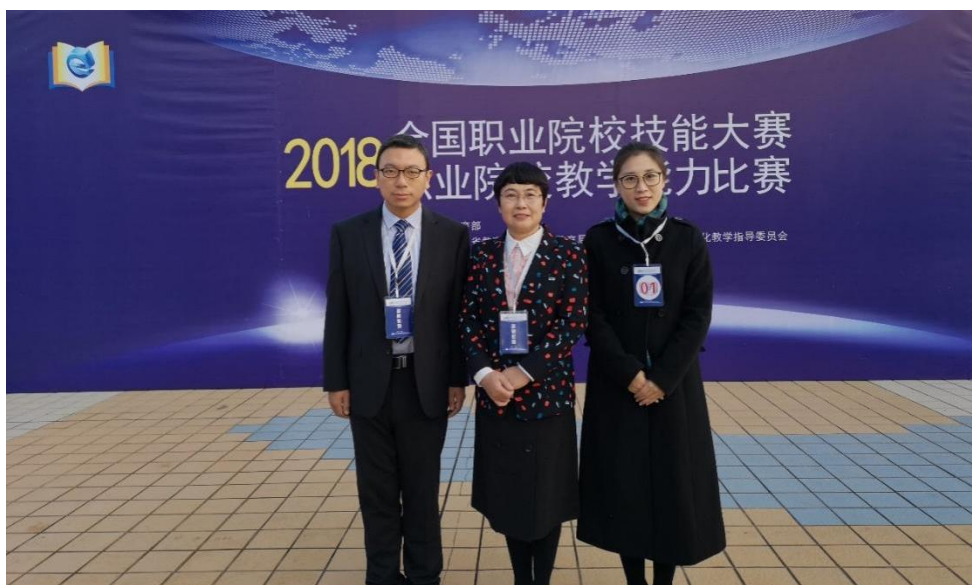
全国职业院校教师教学能力比赛一等奖

现共有专任教师 15 名，全部具有硕士学位，双师型比例达到 100%。教师业务能力强，主持 3 门省级精品课程、1 门省级专业教学资源库、6 门院级精品课程和 5 门院级精品资源共享课。荣获全国高校微课教学比赛一等奖 1 项、二等奖 1 项；全国农业职业院校教学能力大赛一等奖 1 项、二等奖 1 项；山东职业院校教学能力大赛一等奖 1 项、二等奖 2 项；多名教师获院级优质授课教师称号。