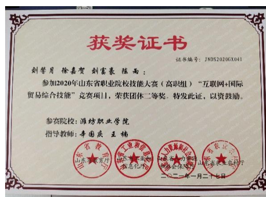
山东省职业院校技能竞赛二等奖