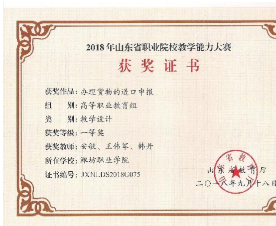
山东省职业院校教学能力大赛一等奖