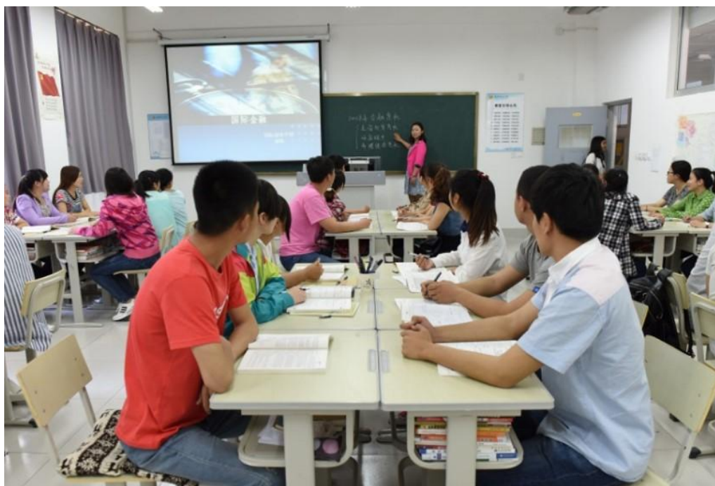
企业管理课程教学