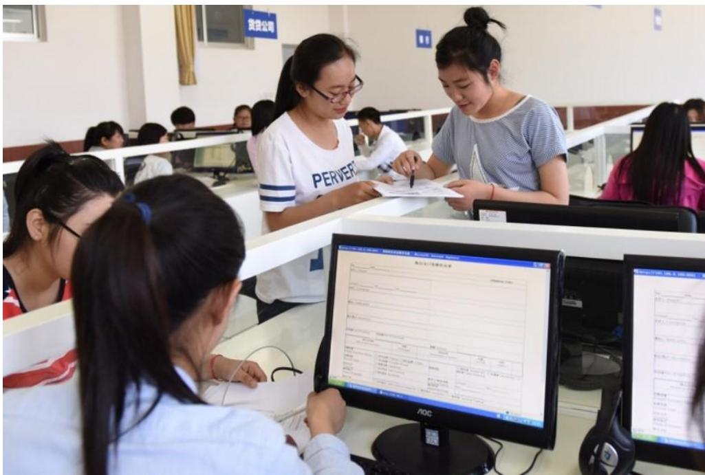
人力资源管理课程实训