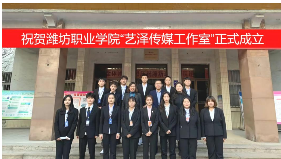
商务管理（校企合作）创业工作室