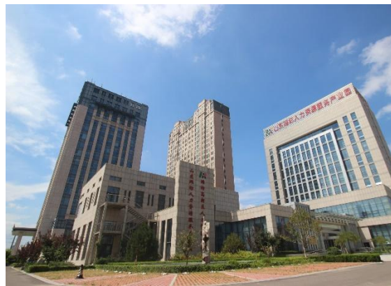
潍坊天泽人力集团