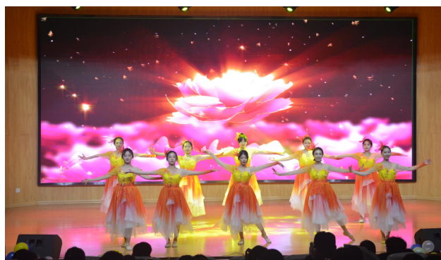
元旦晚会文艺汇演