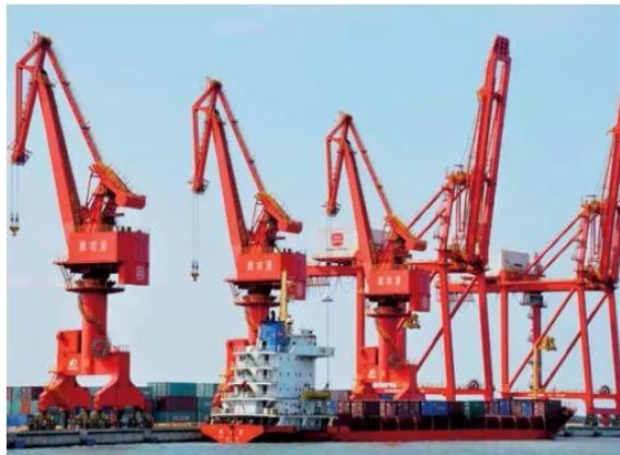
潍坊森达美港有限公司

面向商务策划专业人员等职业、经纪与代理等岗位群。主要就业企业有潍坊港华燃气有限公司、山东新华书店集团、潍坊市联通公司、潍坊森达美港有限公司、山东高速服务区管理有限公司和潍坊天泽人力集团等企业。