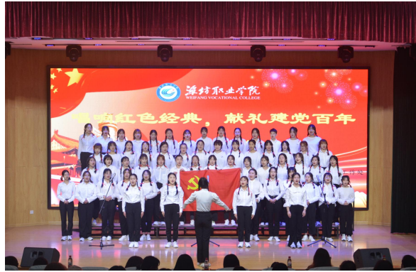
献礼建党百年合唱比赛